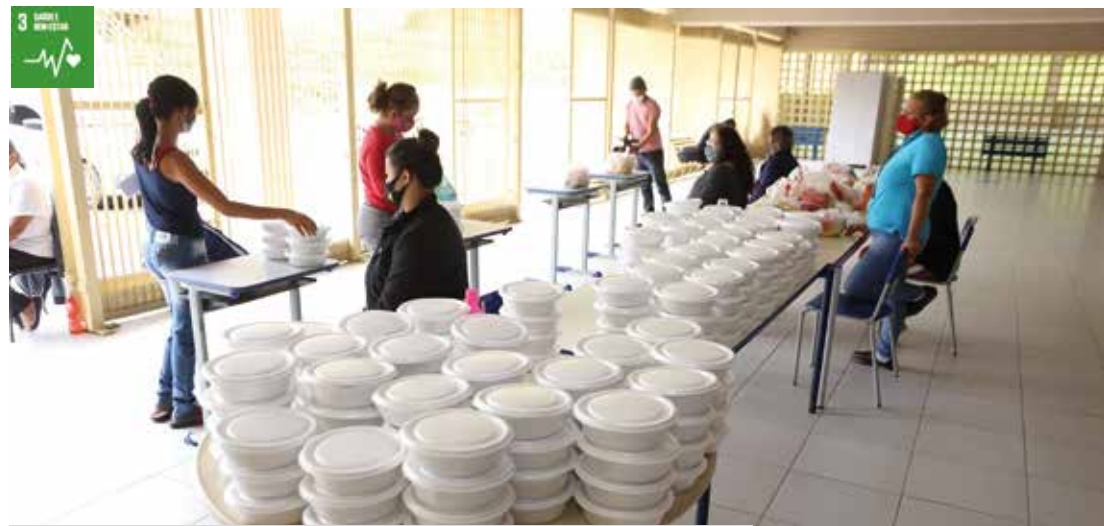
Famílias retiram marmitex no Colégio Alba Bonilha no Jardim São Luis