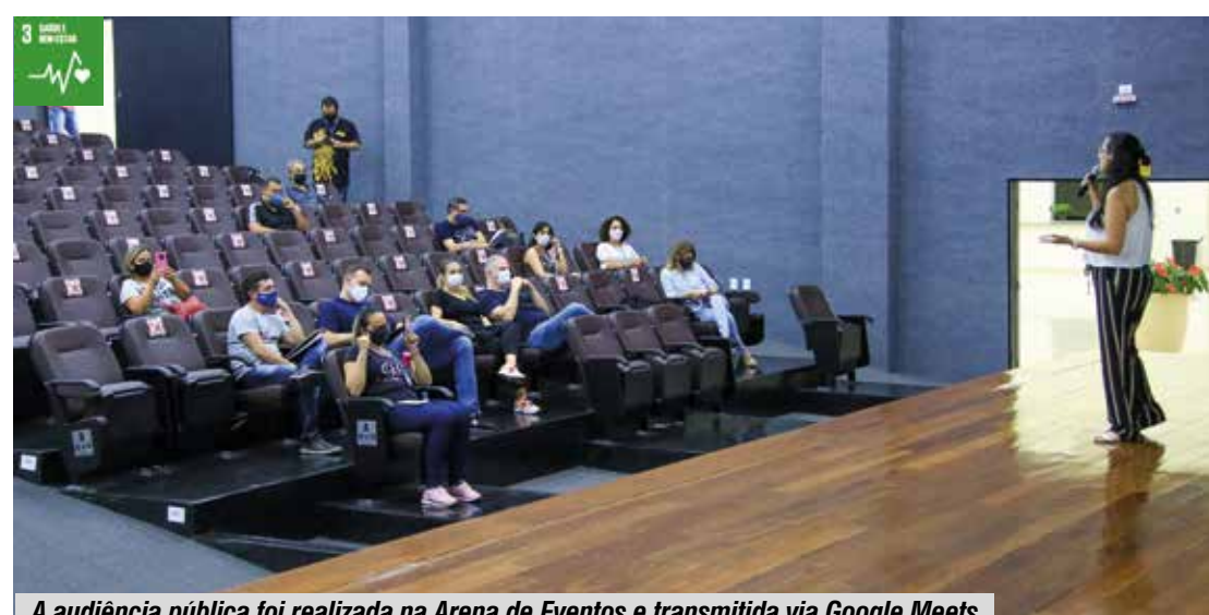
A audiência pública foi realizada na Arena de Eventos e transmitida via Google Meets

Texto: Guilherme Babino