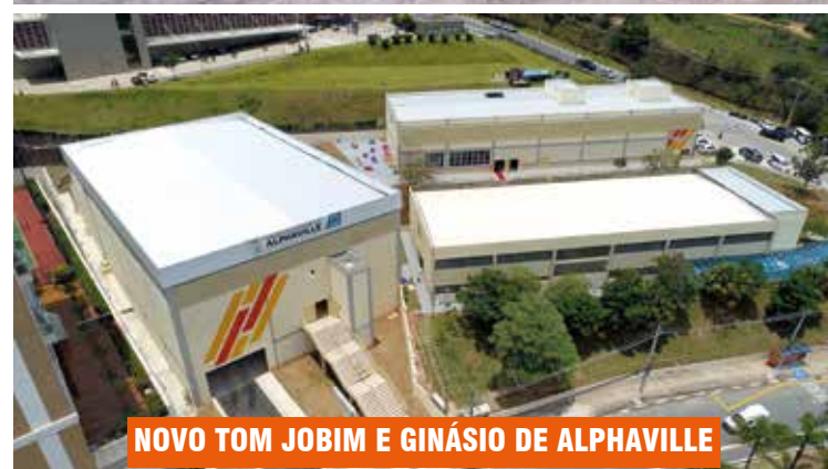
NOVO TOM JOBIM E GINÁSIO DE ALPHAVILLE