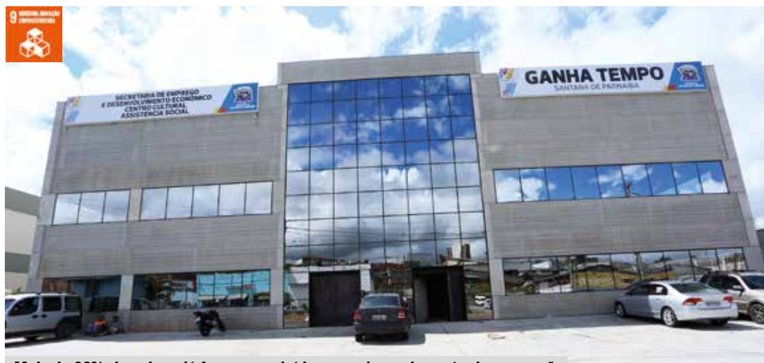
Mais de 90% das obras já foram concluídas e em breve haverá a inauguração