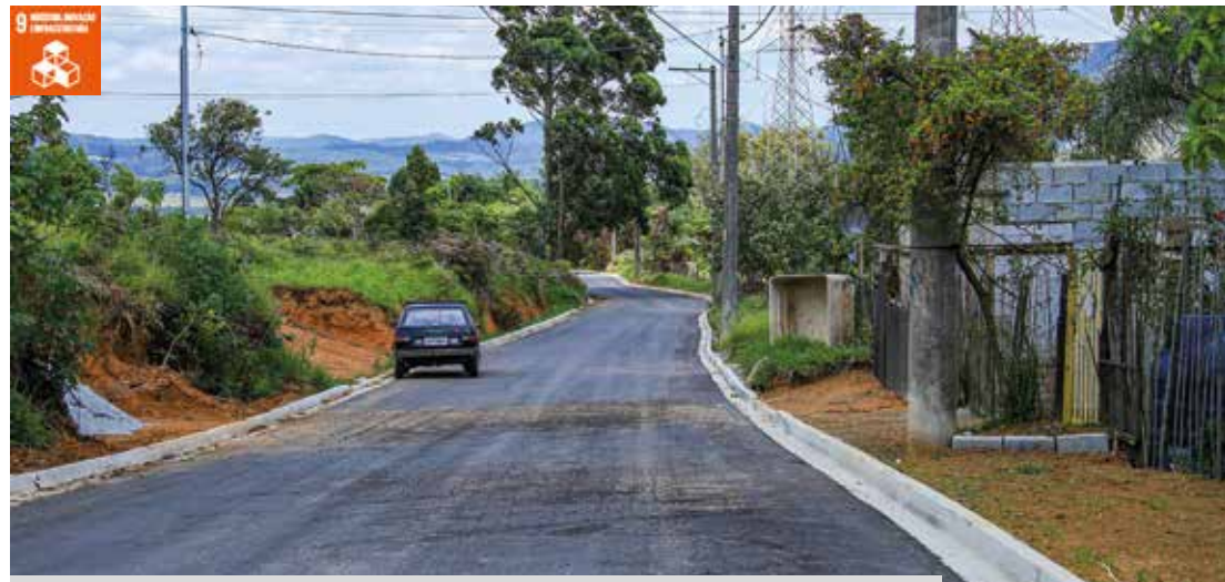
Imagens das ruas do bairro Sítio do Morro que encontra-se 100% pavimentado