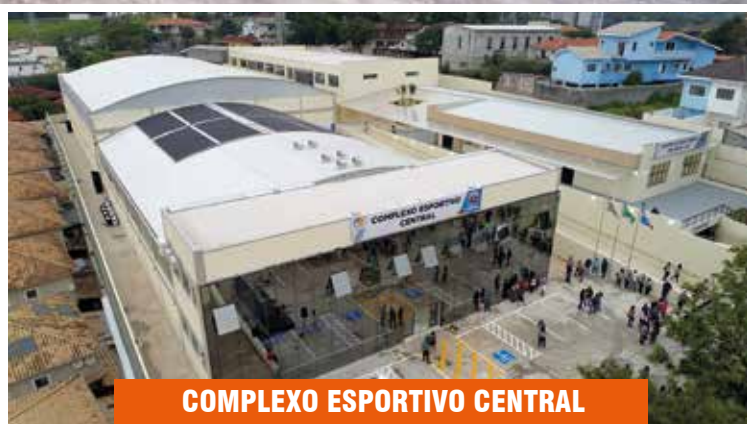
COMPLEXO ESPORTIVO CENTRAL

Imagens das obras inauguradas pela prefeitura no mês em que Santana de Parnaíba completou 440 anos