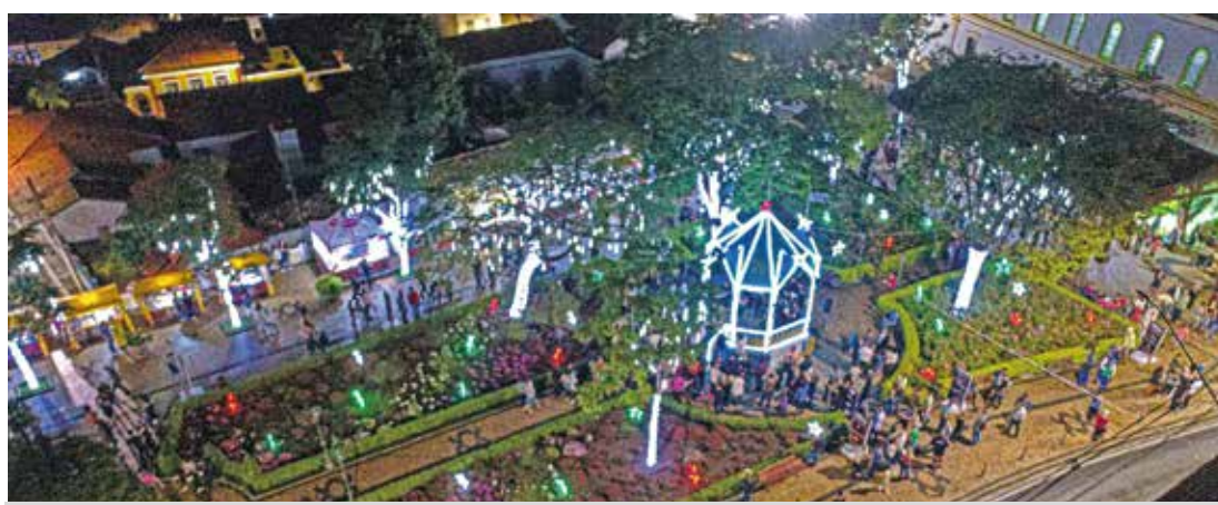
A decoração natalina e o presépio ficarão disponíveis para visitação até o dia 06 de Janeiro de 2021

A Casa do Papai Noel será instalada no CEMIC e será aberta para visitação no dia 12/12, às 20h. As Cantatas de Natal acontecem nos dias 06, 12, 13, 19 e 20/12, sempre às 21h e a praça de alimentação, que também ficará na Praça 14 de Novembro, funciona-