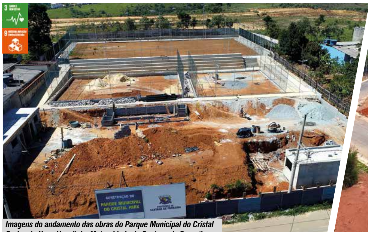
Imagens do andamento das obras do Parque Municipal do Cristal Park e do Novo Hospital e Maternidade de Santana de Parnaíba