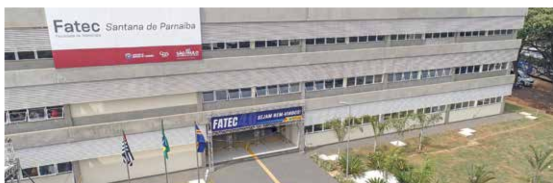
Vestibular Fatec oferece vagas para os cursos de Gestão Comercial, Ciência de Dados, entre outros

Texto: Guilherme Babino