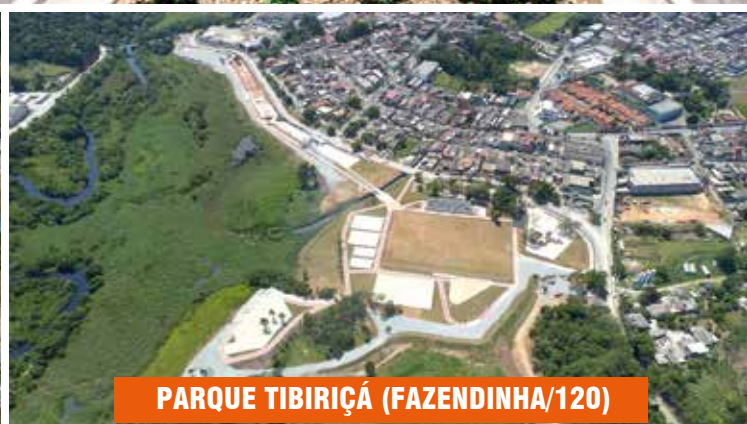
PARQUE TIBIRIÇÁ (FAZENDINHA/120)