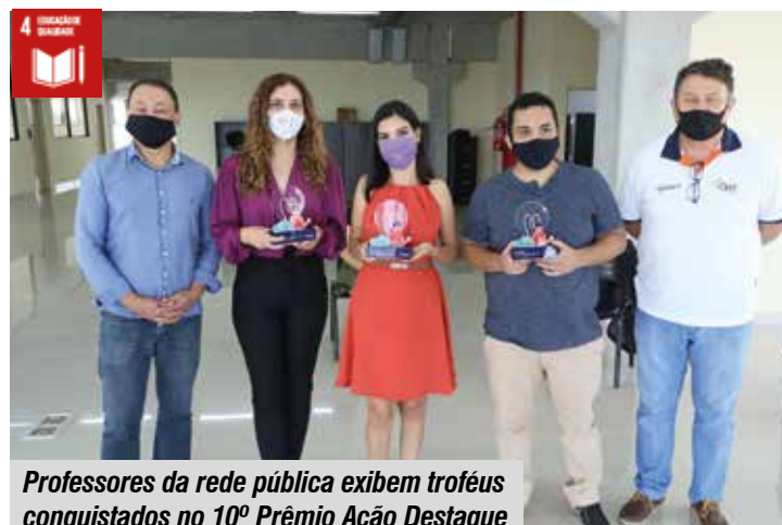
Professores da rede pública exibem troféus conquistados no 10º Prêmio Ação Destaque