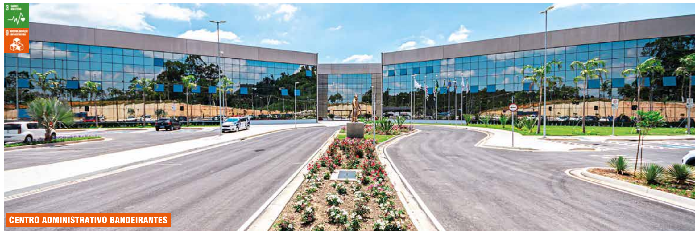
CENTRO ADMINISTRATIVO BANDEIRANTES

Parque Tibiriçá, entrega da primeira etapa da nova ponte e inauguração do Centro Administrativo marcaram as comemorações dos 440 anos da cidade